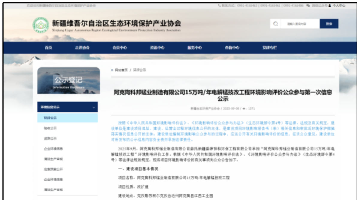
图 1 首次环境影响评价信息网络公示截图