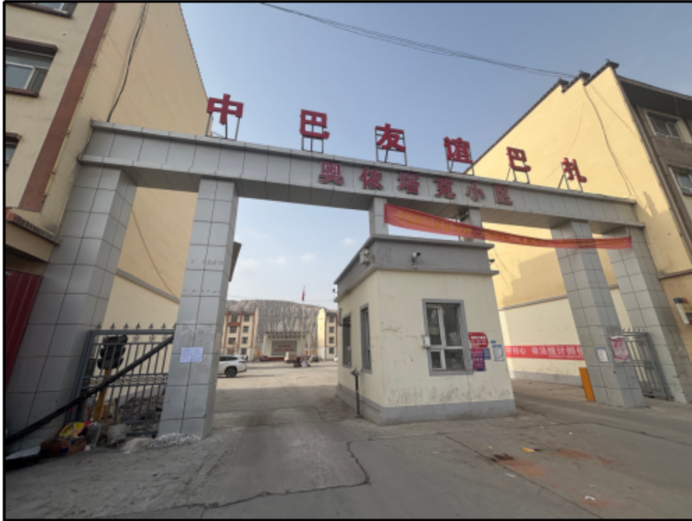
图 7 奥依塔克村现场张贴