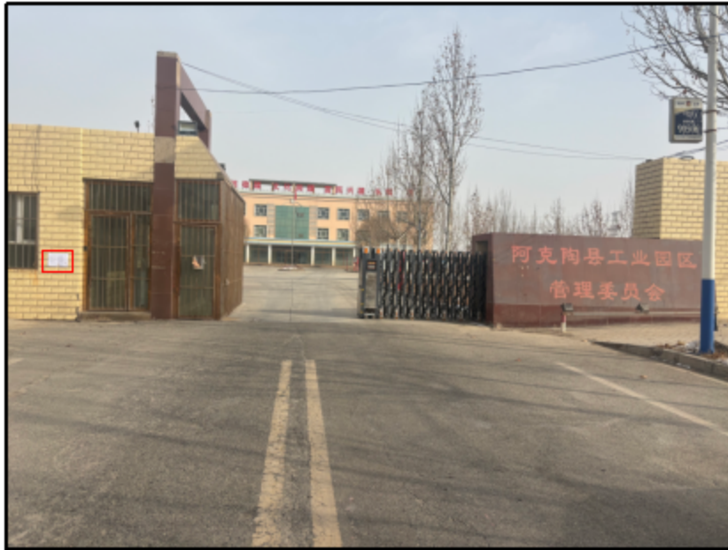
图 5 园区管委会处现场张贴

根据《环境影响评价公众参与办法》，我公司于 2026 年 1 月 28 日在阿克陶江西工业园区管理委员会及周边的村庄依法进行张贴公告，持续公开期限大于 10 个工作日。张贴的区域选择符合《环境影响评价公众参与办法》要求。张贴照片见图 5-图 8。